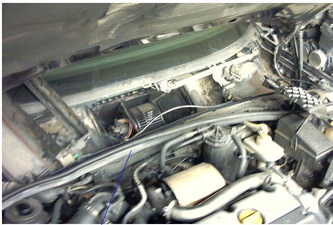
Diese Gummileiste abziehen.

Also: Zunächst die Wischergestängeabdeckung am unteren Rand der Windschutzscheibe abmontiert. Die kann durch Rausziehen aus den Gummileisten gelöst werden. Unter der Abdeckung befindet sich der Reinluftfilter, den abgemacht (ist nur links und rechts geklipst). Darunter kann man schon die Gehäuseabdeckung des Gebläse motors erkennen. Die ist auch nur geklipst und mit einer kleinen Schraube befestigt. Dummerweise geht die Gebläse motorabdeckung nur ab, wenn der Reinluftfilterkasten weg ist. Den also mit zwei Blechschrauben (hinten, außen) und zwei Plastikmuttern (vorne, innen) lösen. Nun komme ich aber an die rechte Blechschraube nicht ran, weil die Wischergestängeabdeckung komplett weg muß. Dazu müssen die Wischer ab: